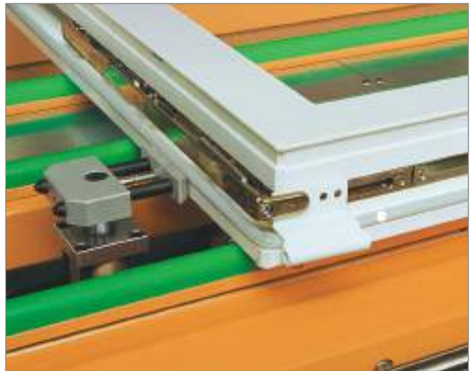
Пневматически опускаемые упоры для устройства измерения длины фурнитуры