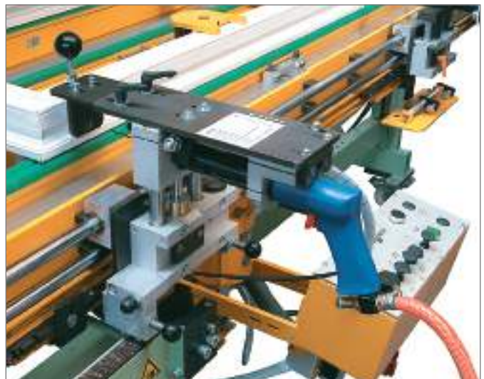
Устройство для сверления отверстий под петли