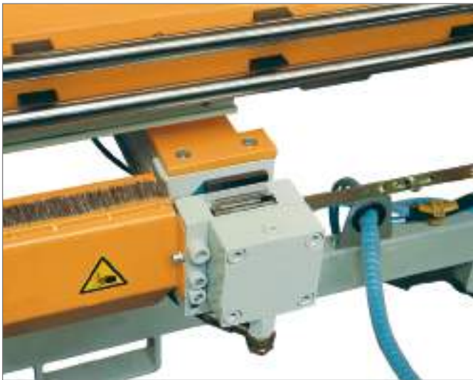
Пресс для отрубания фурнитуры