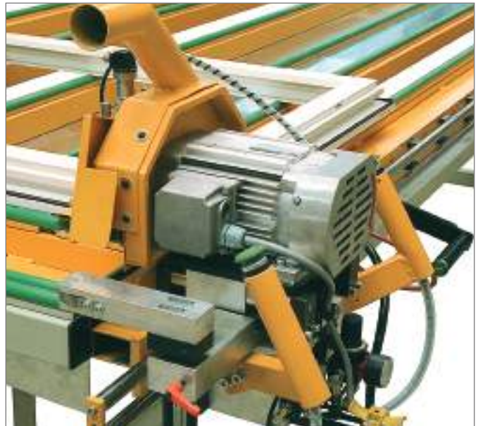
Перемещаемая пила для отрезания наплава створки (при установке штапика)