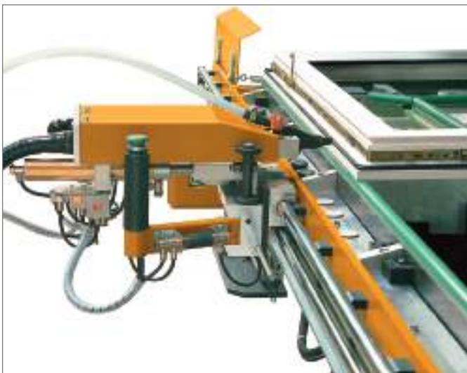
Перемещаемый шуруповёрт с автоматической подачей саморезов