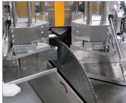
Пильный агрегат с ЧПУ

Панель компьютера управления машиной CP 7037-0002 с 12-ти дюймовым жидкокристаллическим дисплеем, операционная система Windows с пакетом программ для автоматической пилы ZA 550. Имеется дисковод для гибких магнитных дисков, CD-ROM. Выгрузка напильных заготовок осуществляется на стол или ремённый транспортёр.