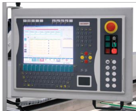
Панель компьютера (Beckhoff)